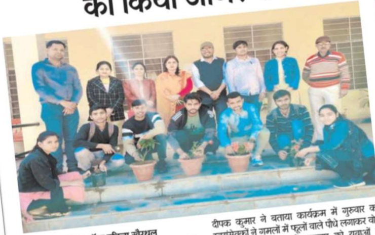
वॉइस ऑफ प्रतिज्ञा खैरथल